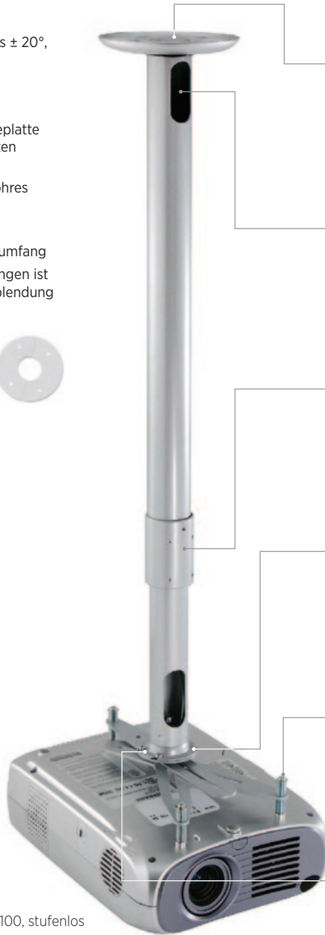
Kindermann Comfort 60/100, stufenlos