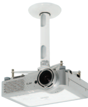
Kindermann Comfort 30